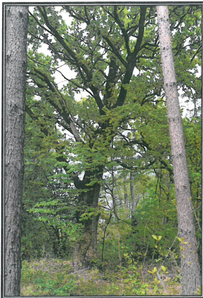
Rys. 1. Drzewo, którego dotyczy wniosek. (Dąb JACKO)

Załącznik nr 2 do Uchwały Nr .... / ..... /2021 Rady Gminy Kuryłówka z dnia ..... 2021 r.