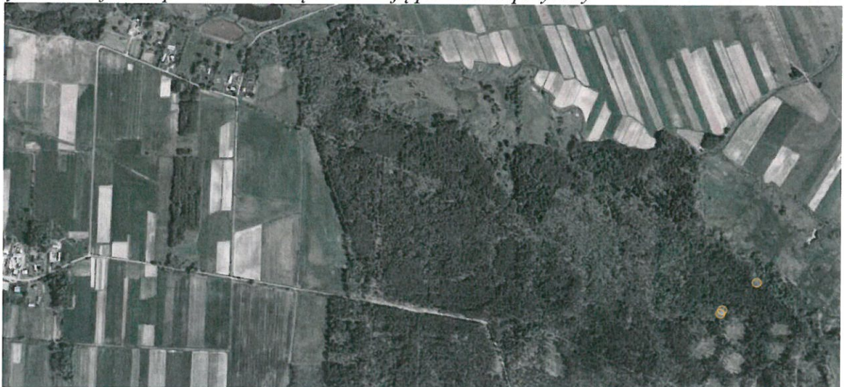
Rys. 1. Ortofotomapa z zaznaczoną lokalizacją pomników przyrody