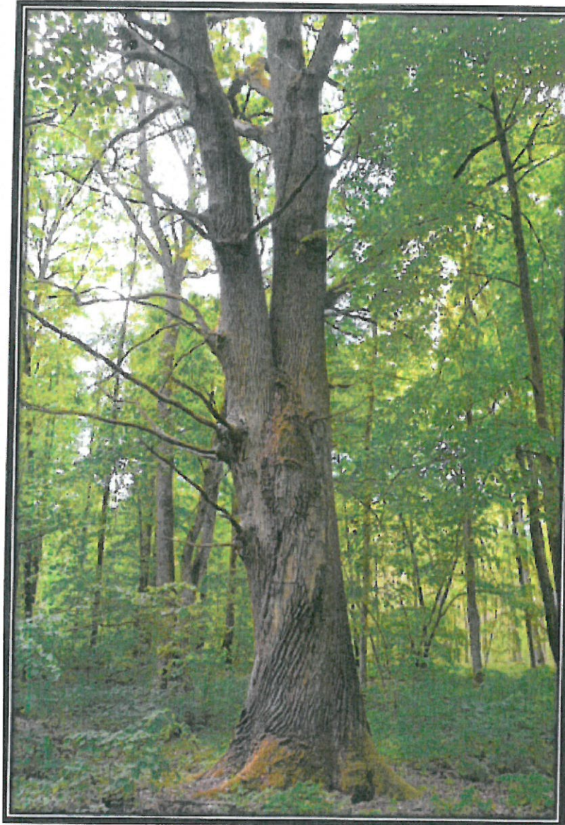
Rys. 2. Drzewo, którego dotyczy wniosek. (Dąb Dmitro)

Załącznik nr 2 do Uchwały Nr .... / ..... /2021 Rady Gminy Kuryłówka z dnia ..... 2021 r.