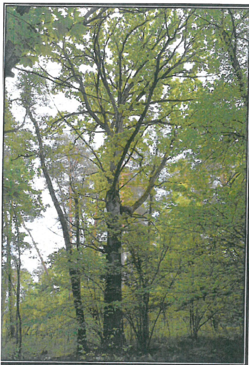
Rys. 2. Drzewo, którego dotyczy wniosek. (Dąb ILKO)

Załącznik nr 2 do Uchwały Nr .... / ..... /2021 Rady Gminy Kuryłówka z dnia ..... 2021 r.